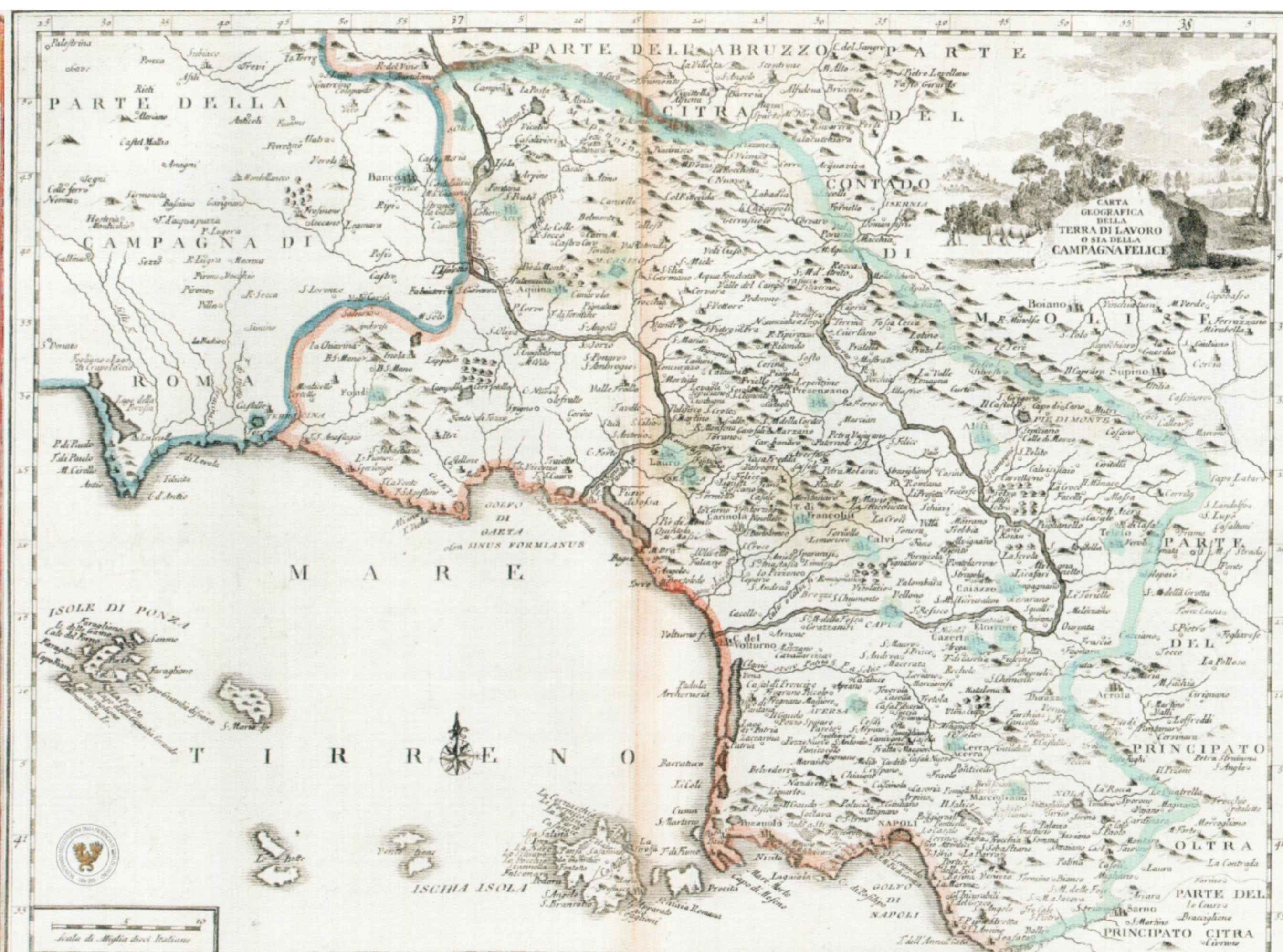
T. Salmon, Carta geografica della Terra di Lavoro , incisione su rame, cm 32,9x43, Venezia 1761