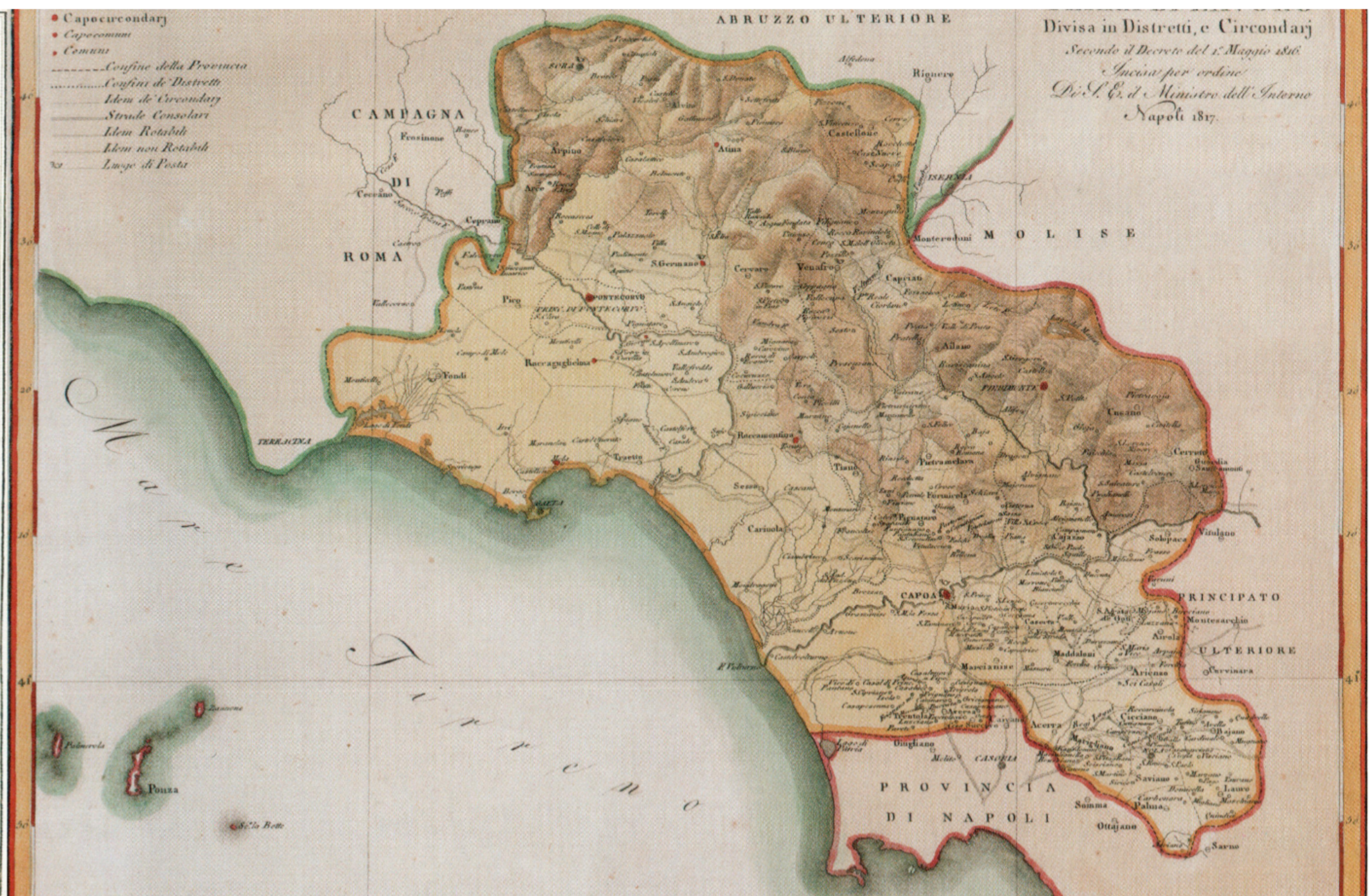
G. Bartoli, Provincia di Terra di Lavoro , incisione su rame, cm 37,7x41,2, Napoli 1817.