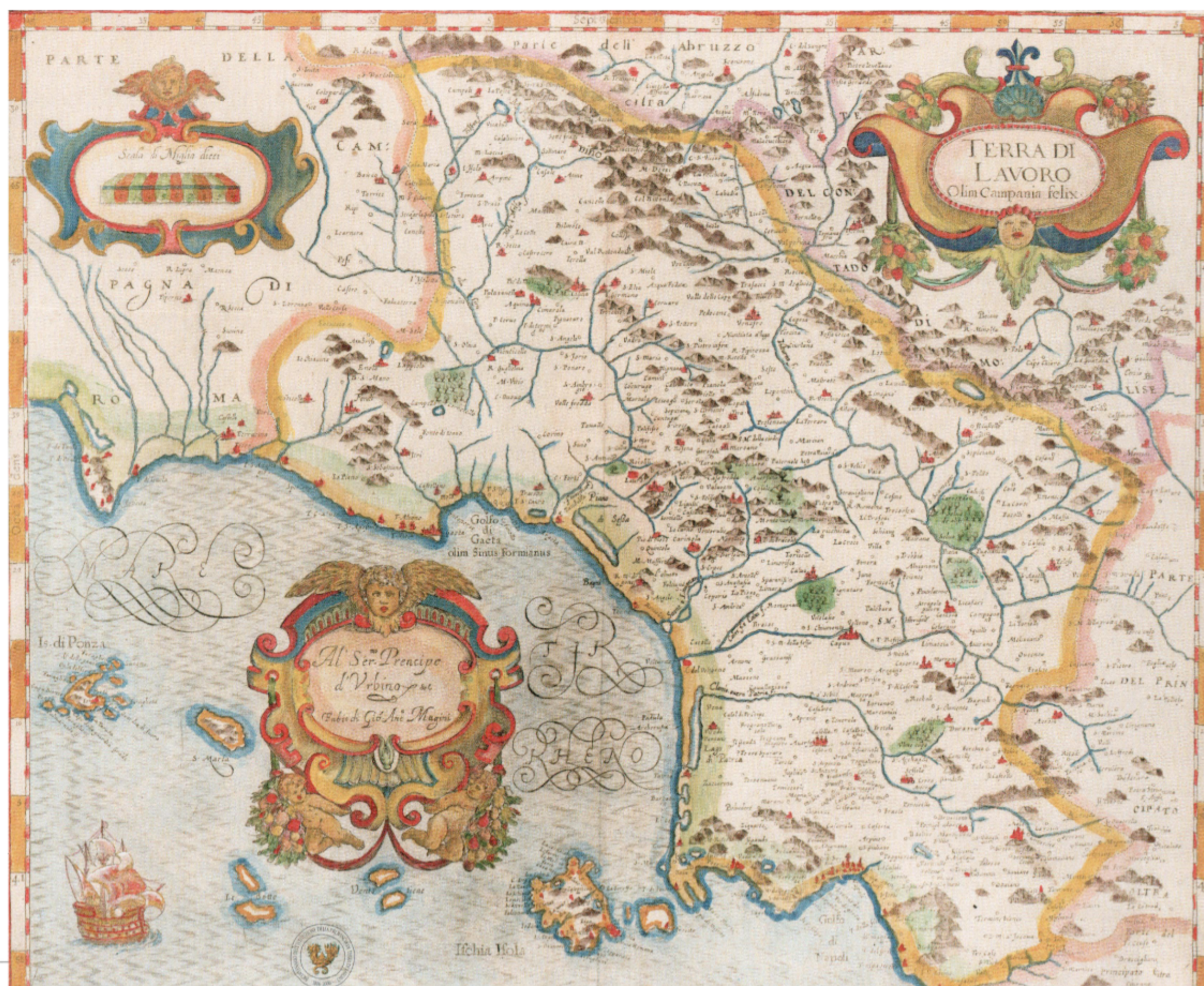
G.A. Magini, Terra di Lavoro olim Campania Felix , incisione su rame, cm 36,9x44, Bologna 1620