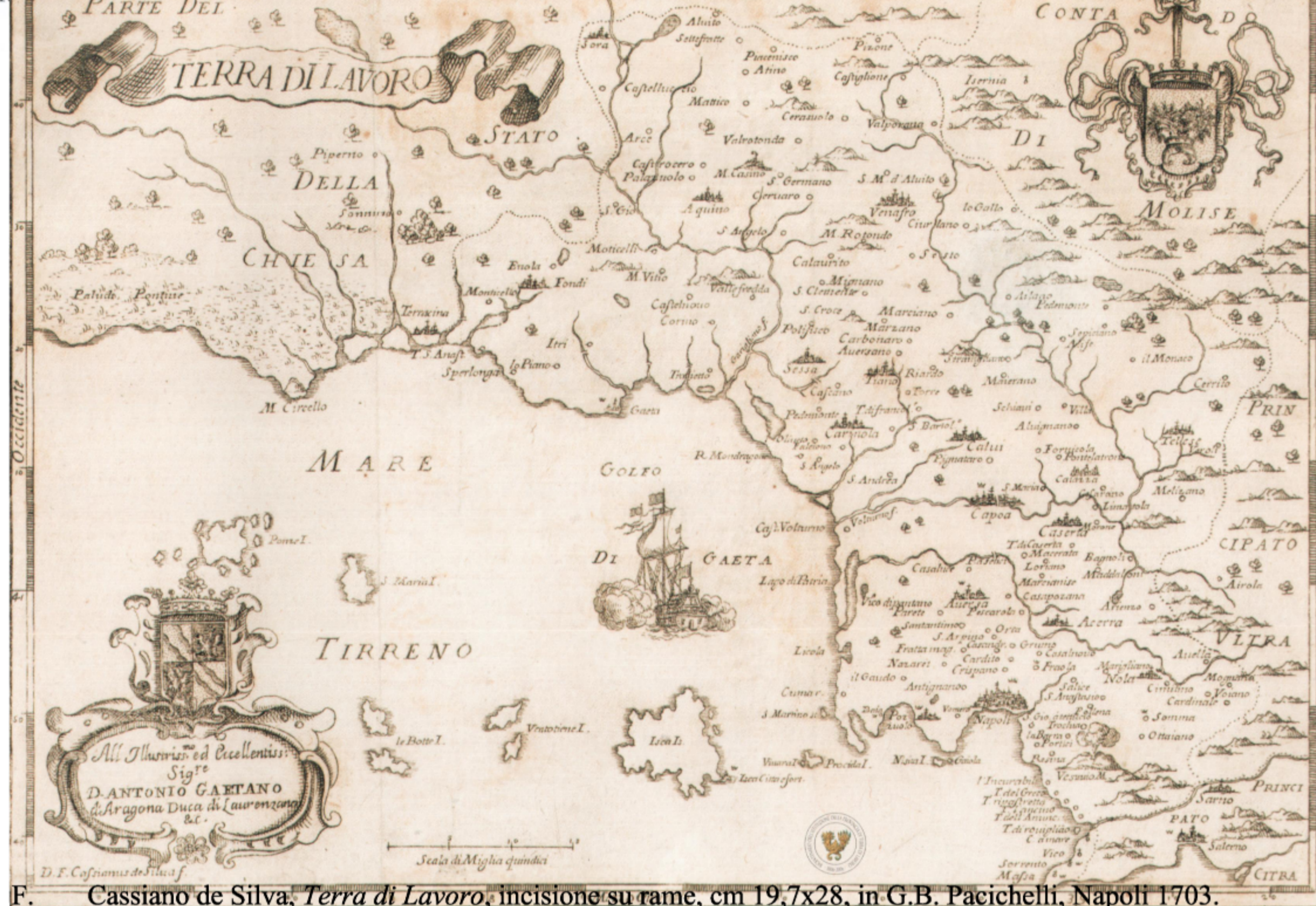
Cassiano di Silva, Terra di Lavoro , incisione su rame, cm 19,7x28, in G.B. Pacichelli, Napoli 1703.