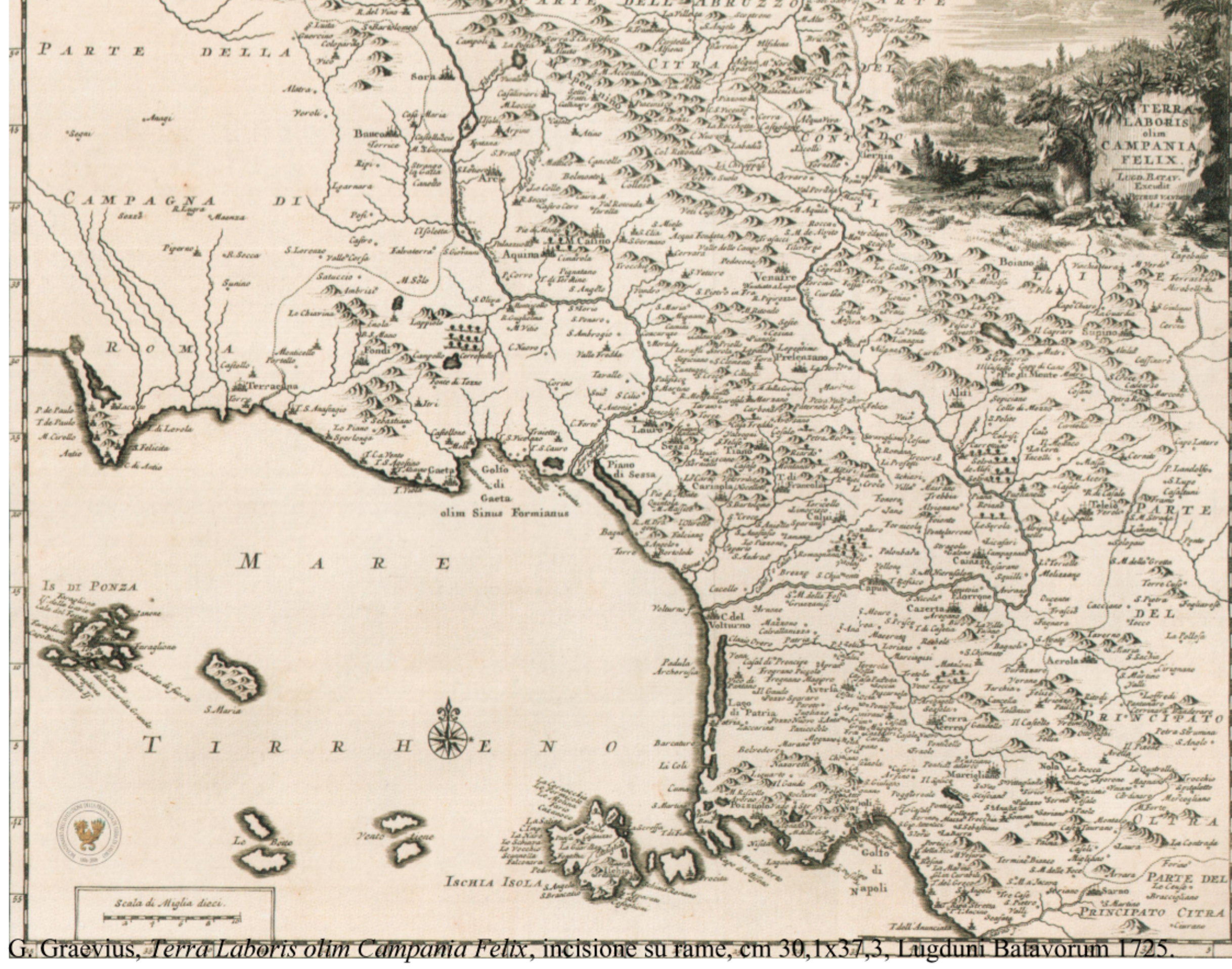
G. Graevius, Terra Laboris olim Campania Felix , incisione su rame, cm 30,1x37,3, Lugduni Batavorum 1725