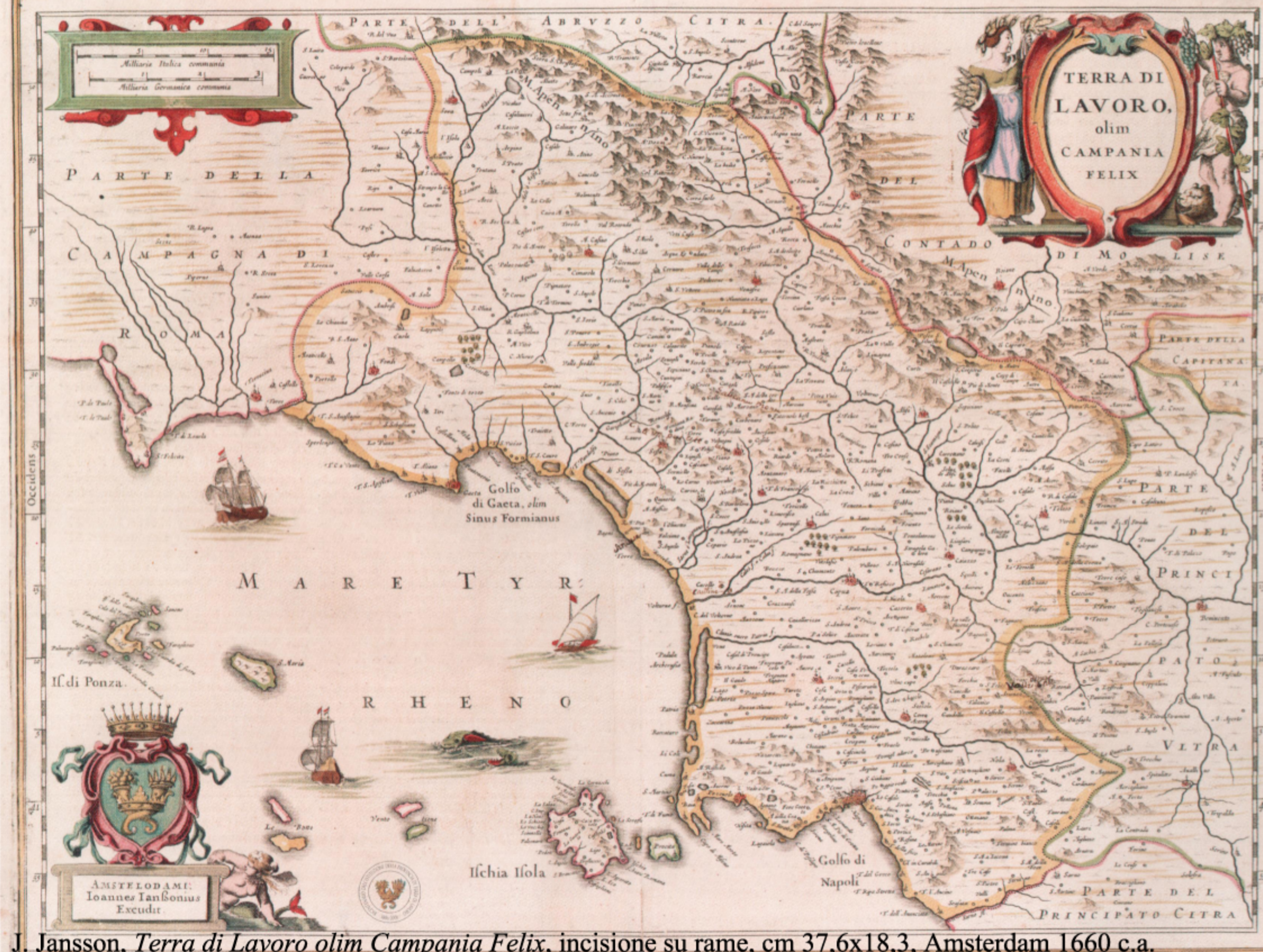
J. Jansson, Terra di Lavoro olim Campania Felix , incisione su rame, cm 37,6x18,3, Amsterdam 1660 c.a.